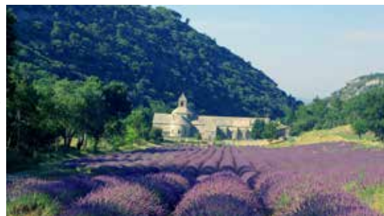
Vpodvečer u opatství Senanque