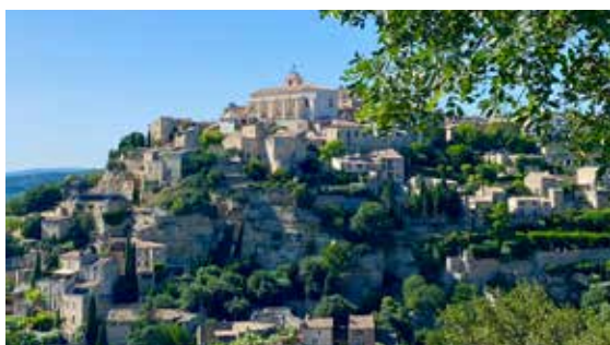
Nejkrásněj- ší vesnice Provence – Gordes