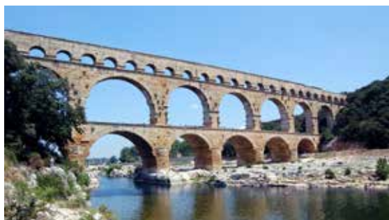
Aquadukt Pont du Gard