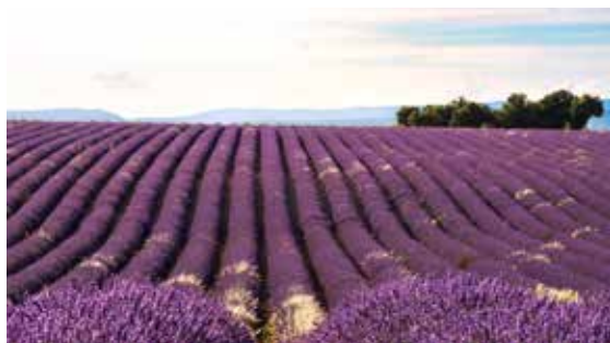
Levandule všude kam se podíváš