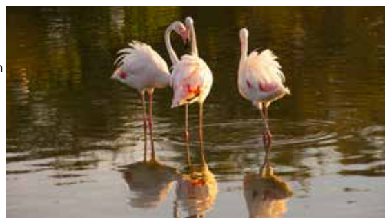
Plameňáci v národním parku Ca- marque