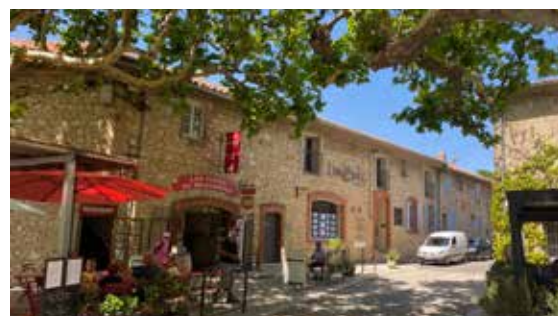
Vinné sklepy Gigondas